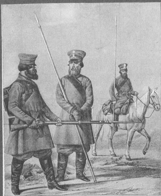
Пѣше и конный войны РЯЗАНСКАГО ДВОРЯНСКАГО ВОЛЧЕНІЯ 1812—1813—1814 гг.