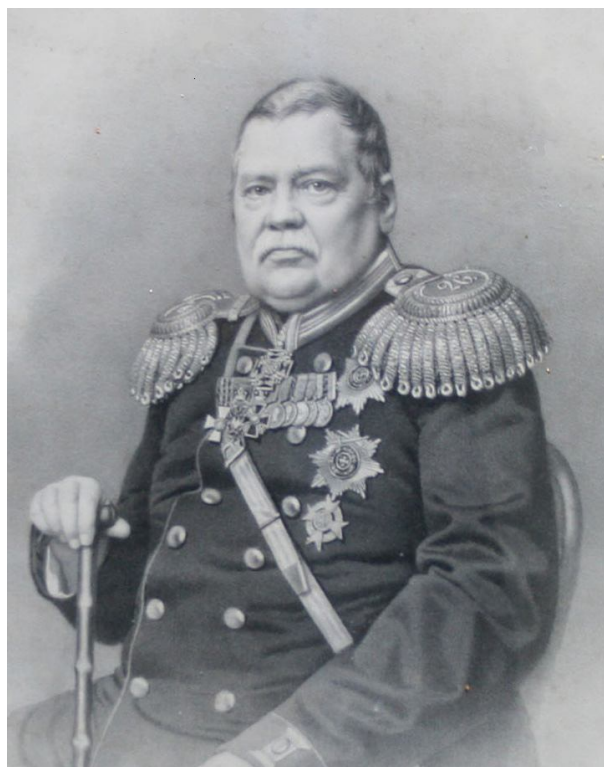
Рис. 5. Виленский генерал-губернатор Михаил Николаевич Муравьев. Литография XIX века Fig. 5. Vilensky General Governor Mikhail Nikolaevich Muravyov. Lithograph of the nineteenth century

В самой Вилейке также была построена каменная церковь, которая была названа в честь Преподобной Марии Египетской. Когда церковь была освещена в 1865 году и стала действовать, генерал Муравьев прислал телеграмму с таким текстом: «Воздвигнутый храм – лепта в память о тех русских, которые пали при усмирении послед-