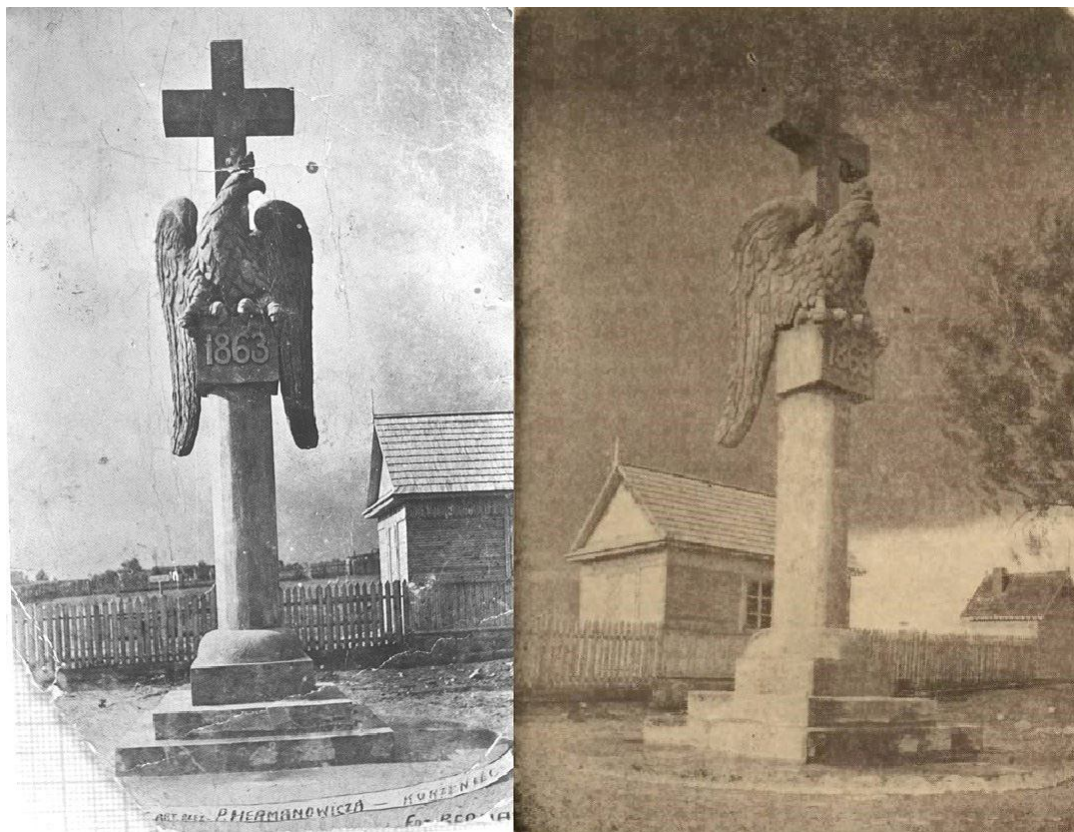
Рис. 3. Памятник польским повстанцам, установленный в местечке Куренец. Фотографии 30-х годов XX века Fig. 3. Monument to the Polish rebels installed in the town of Kurenets. Photos of the 30s of the twentieth century