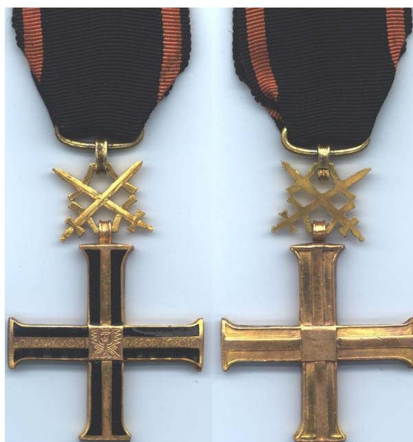
Рис. 7. Польская награда Крест Независимости с мечами. Аверс и реверс