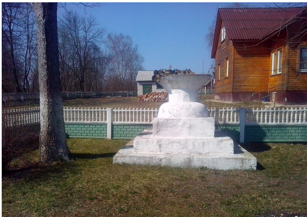
Рис. 4. Остатки памятника повстанцам в Куренец. Современное состояние. Фотография апреля 2019 г. Fig. 4. Remains of a monument to rebels in Kurenets. Current state of the art. Photo of April 2019