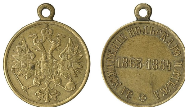
Рис. 6. Медаль «За усмирение польского мятежа 1863–1864 гг.». Аверс и реверс

Как видно из всего выше написанного, на территории Вилейского района есть много памятных