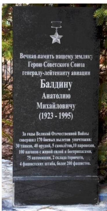
Памятный знак в с.Шопша. Установлен в 2017 году